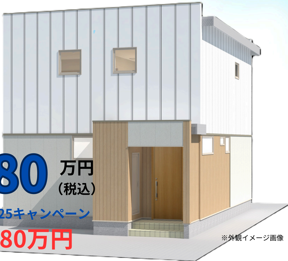
※外観イメージ画像