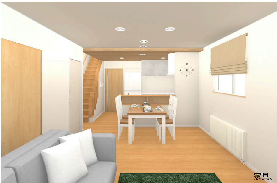
家具、小物は含まれません